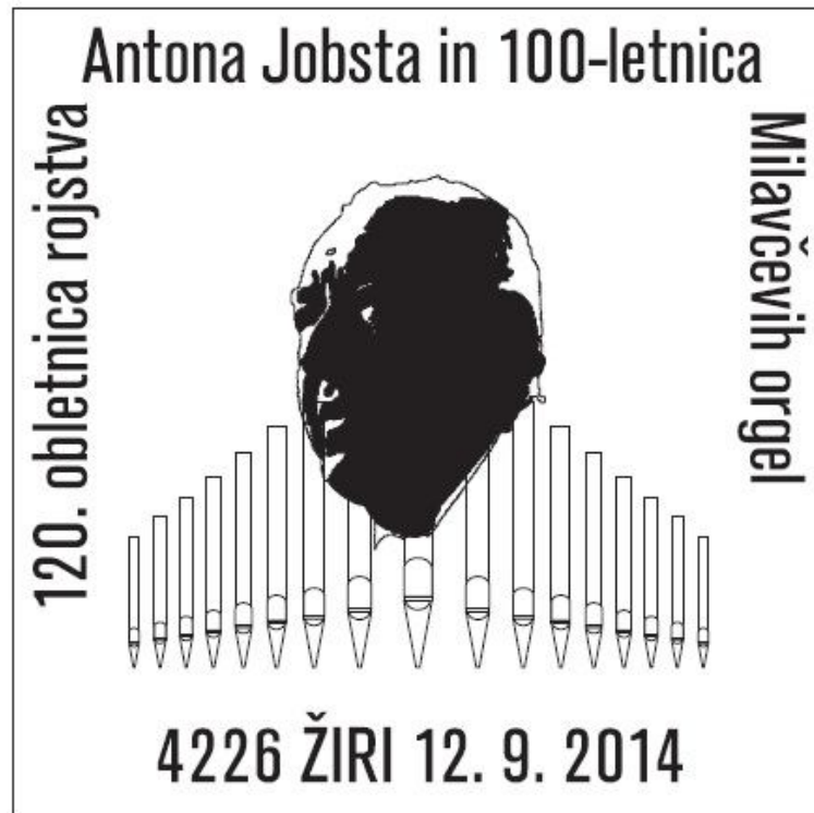
Priložnostni poštni žig