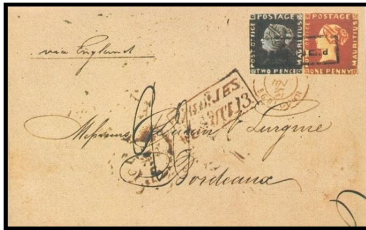
(slika je simbolična)

Še nekaj o znamkah. Izšli sta 1847 le 7 let po prvi poštni znamki črnem peniju. Seveda so se oblikovalci teh znamk zgledovali po njem. Po barvah pa sta dobili ime »modri Mauritius« in »oranžni Mauritius«. Cent teh dveh znamk je visoka predvsem, zato, ker jih obstaja samo še dvanajst. Polovica je žigosanih, druga polovica pa čistih. Seveda obstajajo optimisti, ki pričakujejo odkritje še kakšne.